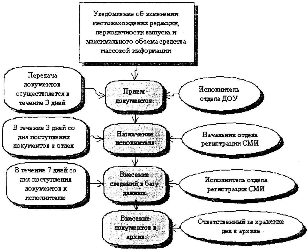
Блок-схема административной процедуры. Выдача дубликата свидетельства о регистрации СМИ