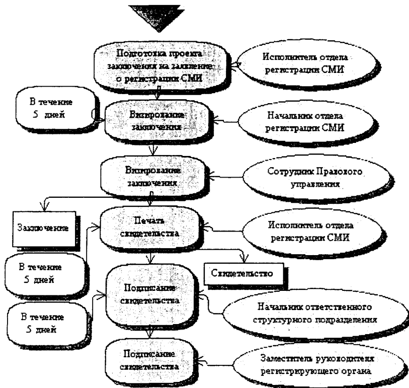
Блок-схема административной процедуры Уведомление об изменении местонахождения редакции, периодичности выпуска и максимального объема средства массовой информации